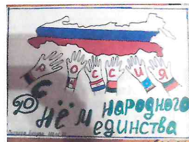
Петухов Богдан МЛ 22-21