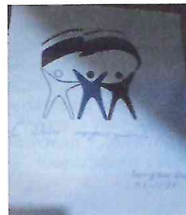
Золотухин Денис МЛ 22-21