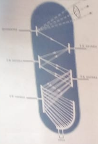
СХЕМА КОМПЛЕКТОВАНИЯ ФОТОЭЛЕМЕНТОМ